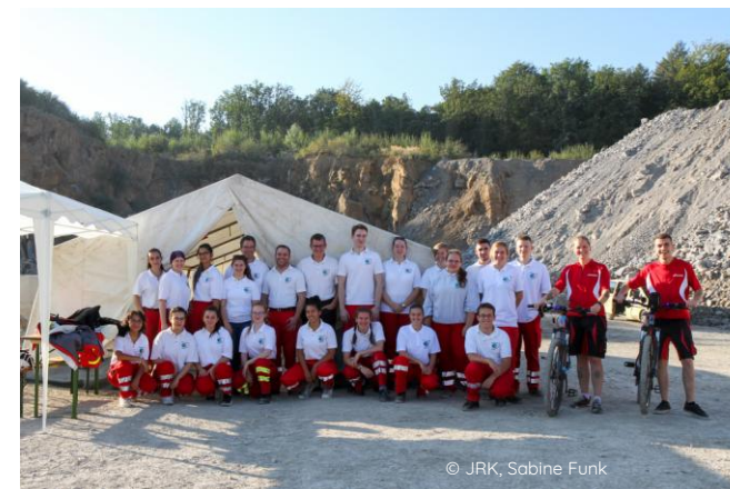
Це частина Молодіжного Червоного Хреста в місті Вупперталь під час проходження смуги перешкод.

Ви навчите нас трохи української...і ми обов'язково порозуміємося